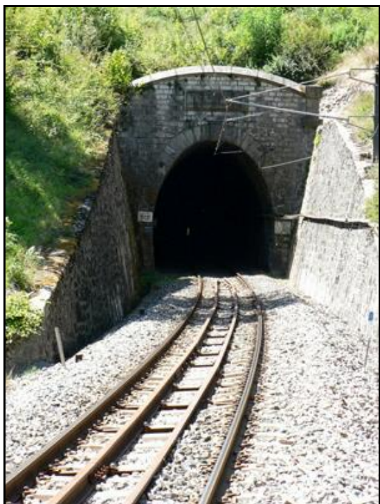
La voie avec ses rails de renfort centraux