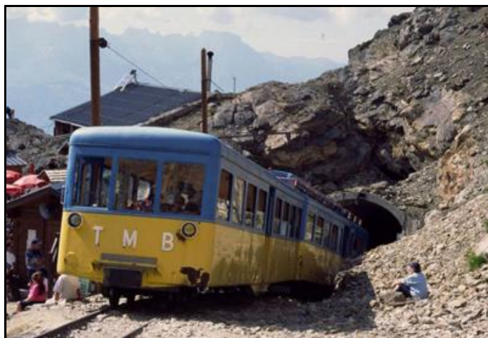
Ci-dessus et ci-dessous, deux vues de la gare d'arrivée du Nid d'Aigle et de la sortie du tunnel n° 2