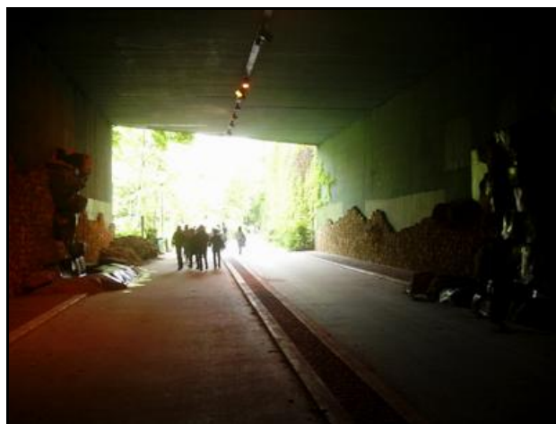
La galerie agrémentée de fausses rocailles