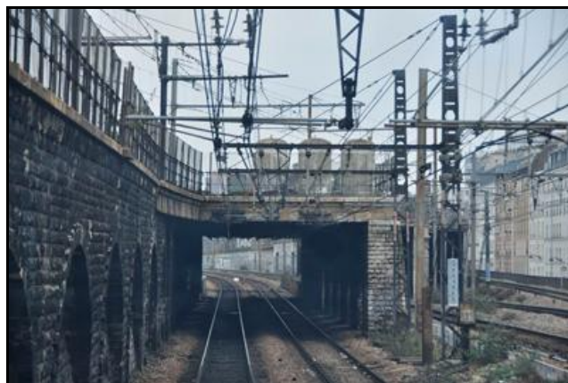
La galerie à deux voies