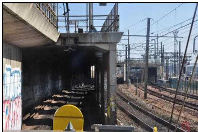
La galerie Est à voie unique