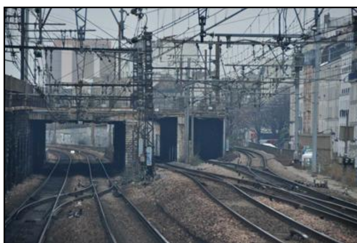
Ci-dessus et ci-dessous, les trois galeries du saut de mouton de Bercy