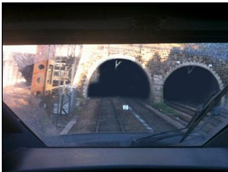
Photo prise depuis la cabine de conduite d'un TGV