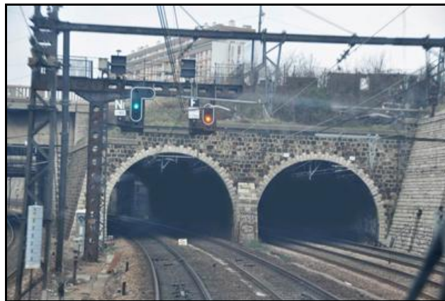
Ci-dessus et ci-dessous, la galerie ouest est à gauche