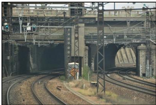
La galerie ouest est la galerie visible