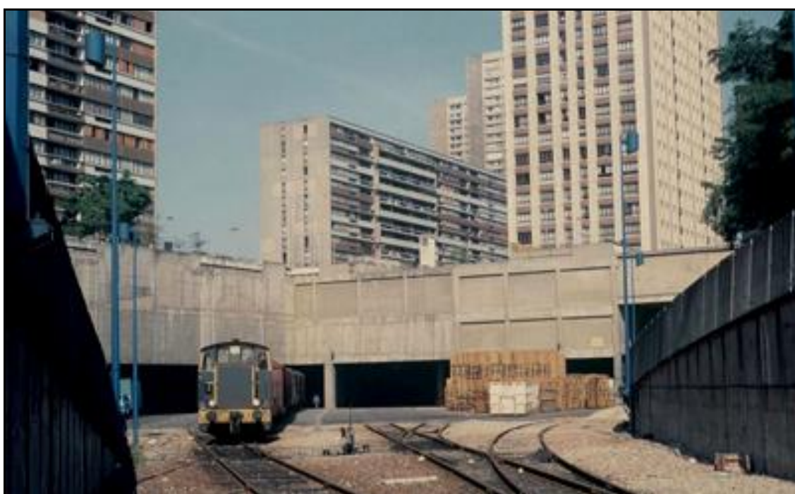
L'entrée de la gare souterraine du temps où elle était encore en service