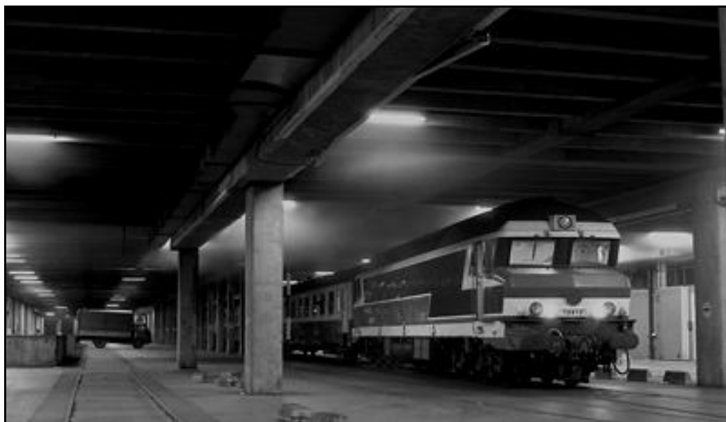
L'intérieur de la gare