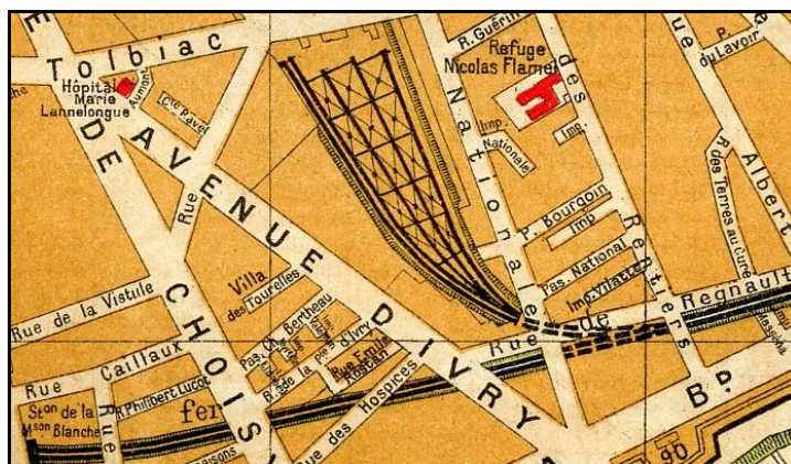
Extrait de carte ancienne montrant le plan des voies de la gare de Paris Gobelins

Les points jaunes indiquent, du bas vers le haut, les galeries voisines de Ivry, n° 75113.12, et Paris Gobelins, n° 75113.14