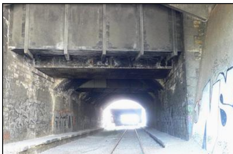
La galerie et le dessous de la gare de Montrouge Ceinture A l'arrière-plan, la galerie de Petit Montrouge

En fond, l'entrée du tunnel de Montsouris