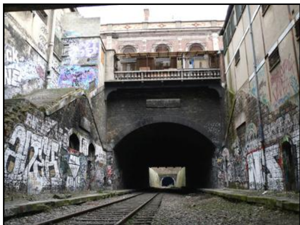
Au fond, l'entrée du tunnel de Montsouris