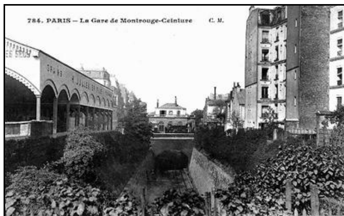
La gare de Montrouge Ceinture à la grande époque de la vapeur Sur la photo de gauche, la galerie de Petit Montrouge qui précède la gare et recouvre ses quais, n'existe pas encore