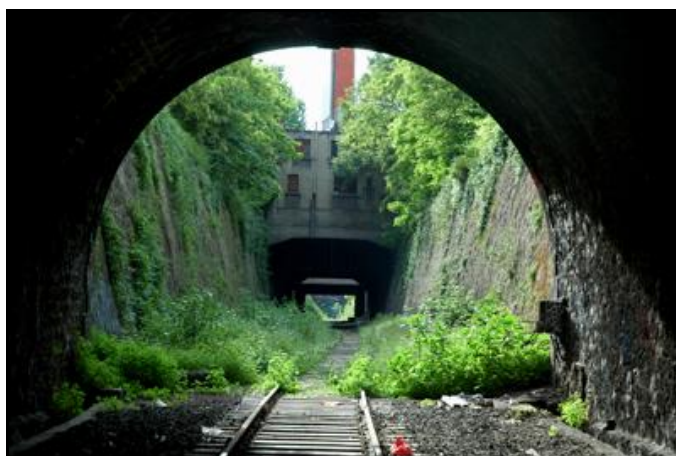
La sortie de la galerie de Montrouge Ceinture vue depuis l'entrée du tunnel de Montsouris