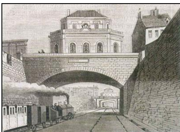
Ci-contre, la gare de Montsouris dans les premiers temps de la petite ceinture. Au fond, la gare de Maison Blanche