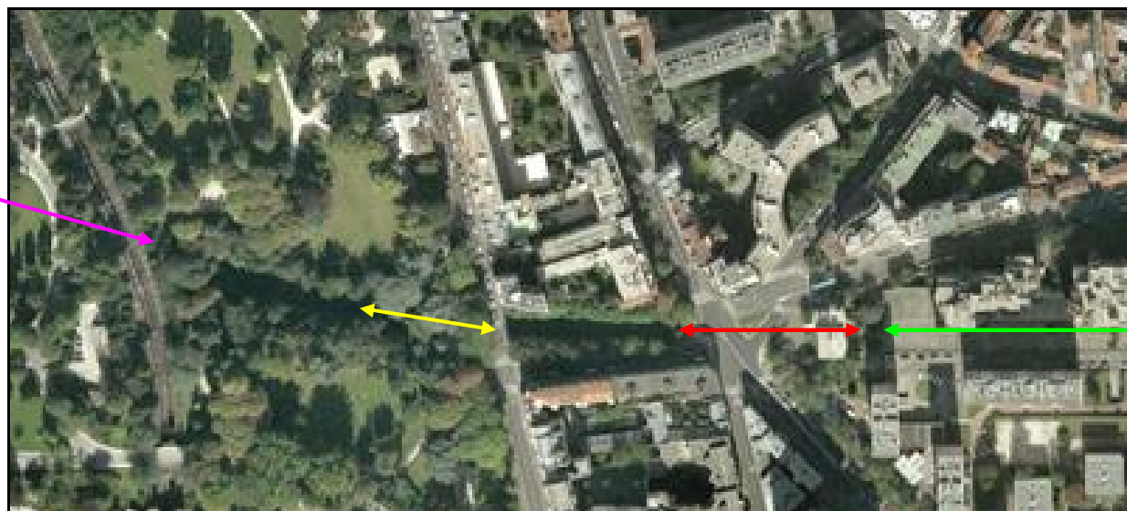
Vue aérienne des galeries de Gazan et Montsouris Ceinture

Flèche violette : sortie du tunnel de Montsouris