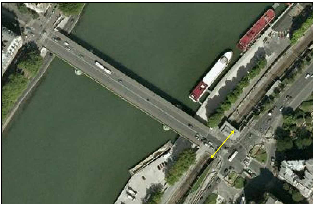
Vue aérienne de la galerie

Si cette fiche comporte des erreurs ou des oublis, merci de nous le signaler.