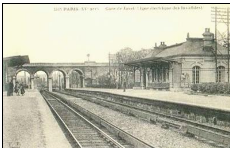
Vers 1920, la gare de Javel, future gare du Boulevard Victor RER C