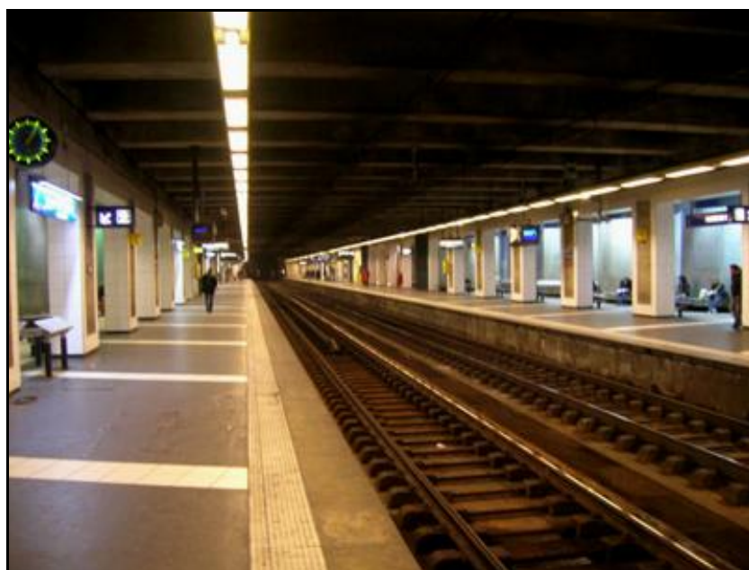
Gare souterraine de la porte de Clichy