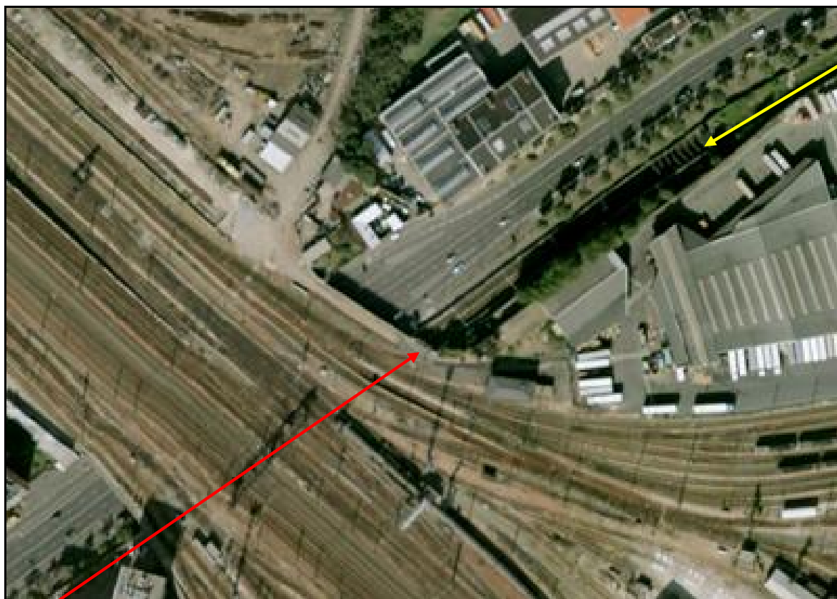
Vue aérienne de la courte tranchée à ciel ouvert séparant le tunnel de Boulainvilliers RER C (flèche rouge) de la galerie de Clichy (flèche jaune)

Si cette fiche comporte des erreurs ou des oublis, merci de nous le signaler.