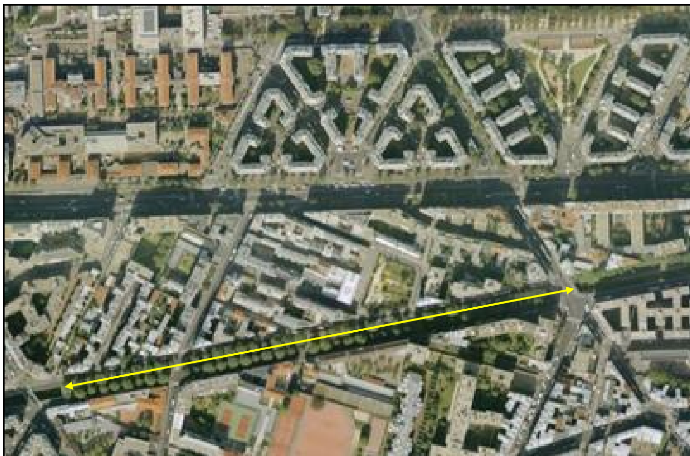
Vue aérienne de la galerie de Saint Ouen

Si cette fiche comporte des erreurs ou des oublis, merci de nous le signaler.