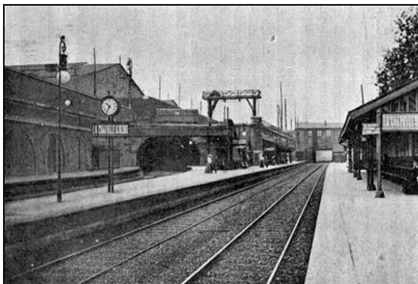
Ci-contre, la sortie de la galerie des Poissonniers, du temps de la vapeur