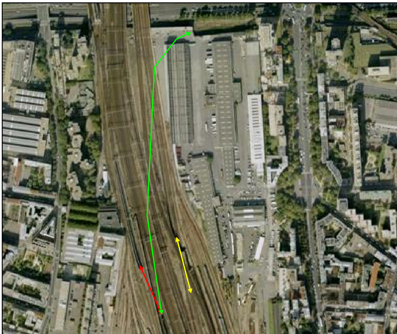
Vue aérienne des galeries des Poissonniers Flèche jaune : galerie des Poissonniers 1 Flèche rouge : galerie des Poissonniers 2 Flèche verte : galerie des poissonniers 3

Si cette fiche comporte des erreurs ou des oublis, merci de nous le signaler.