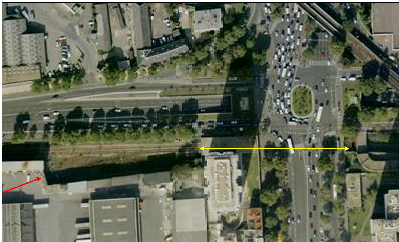
Vue aérienne de la galerie de la Porte de la Chapelle Flèche jaune : galerie de la Porte de la Chapelle Flèche rouge : sortie de la galerie de raccordement des Poissonniers 3

Si cette fiche comporte des erreurs ou des oublis, merci de nous le signaler.