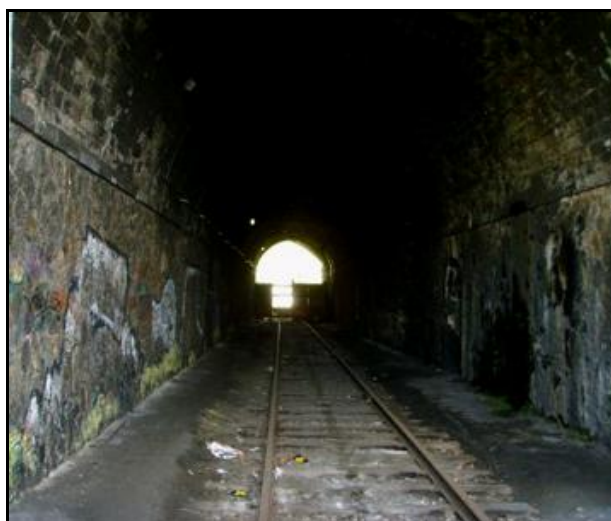
La galerie de l'embranchement particulier est à voie unique