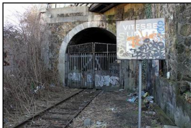
La sortie de l'embranchement particulier est à voie unique