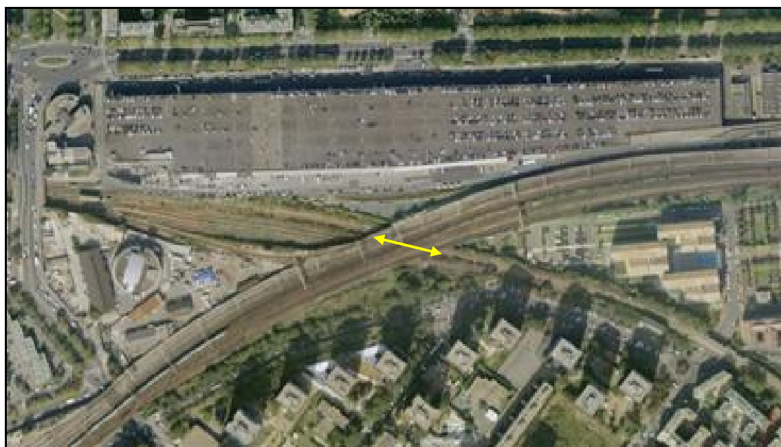
Vue aérienne du saut de mouton d'Est Ceinture

Si cette fiche comporte des erreurs ou des oublis, merci de nous le signaler.