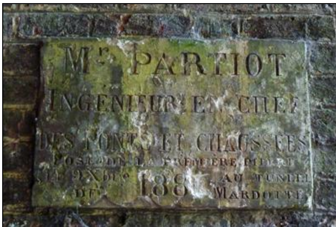
Plaque à la mémoire de l'ingénieur en chef qui a construit le tunnel en 1881

Si cette fiche comporte des erreurs ou des oublis, merci de nous le signaler.