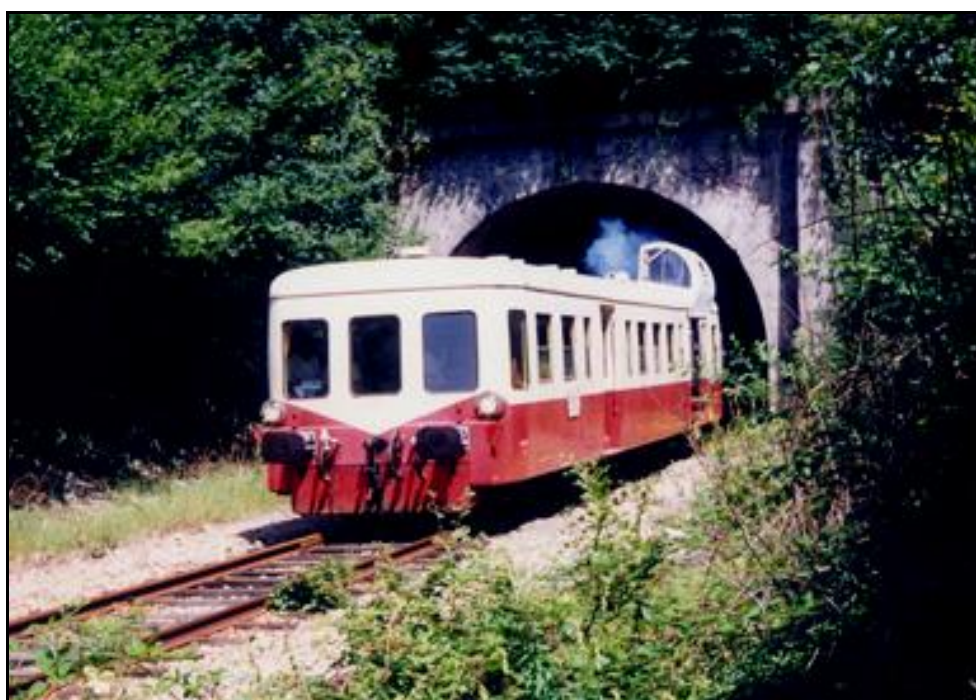
Un autorail Picasso pénètre dans le tunnel de Mardotte