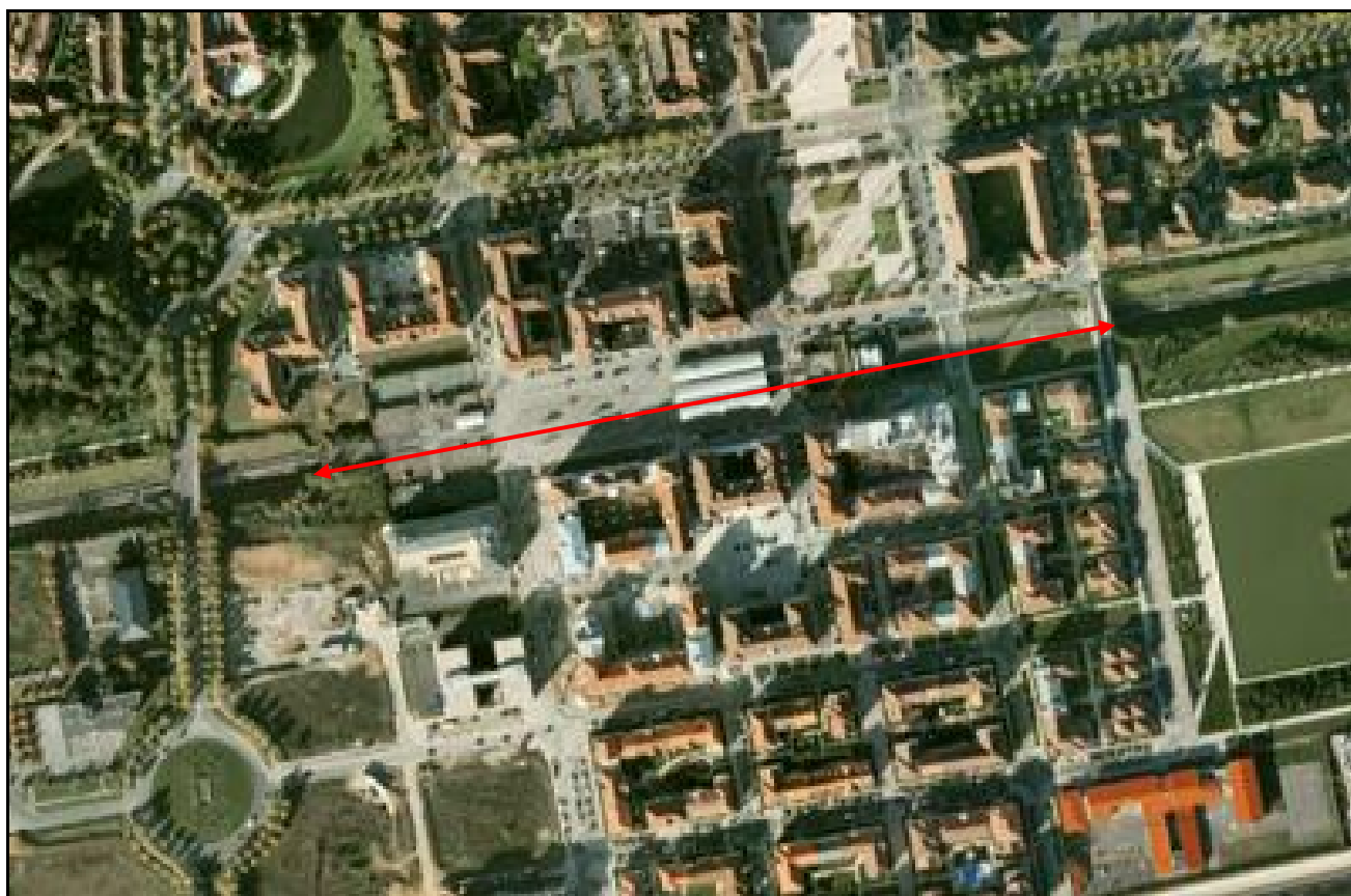
Vue aérienne de la gare de Bussy Saint Georges et de son faux tunnel