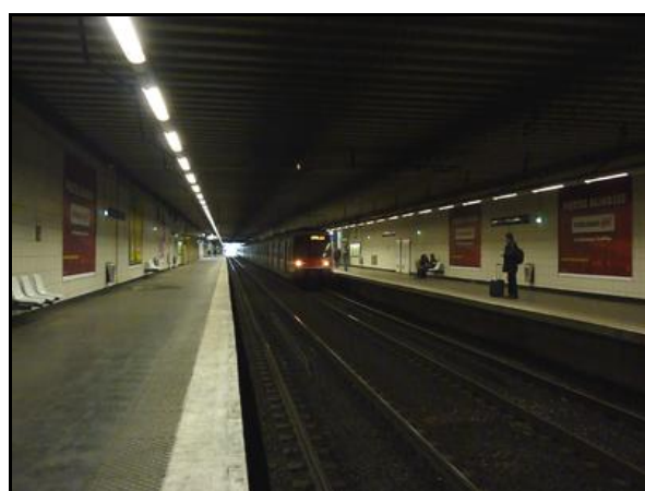
Ci-dessus et ci-dessous, divers aspects de la gare souterraine de Bussy Saint Georges