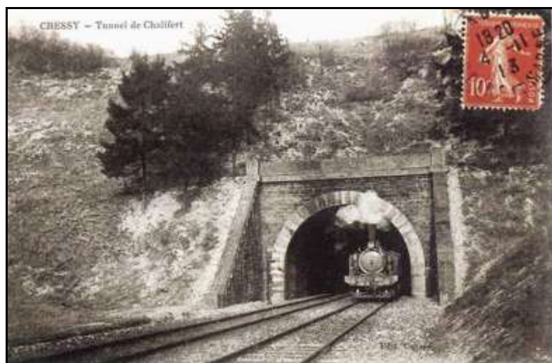
L'entrée du tunnel du temps de la vapeur