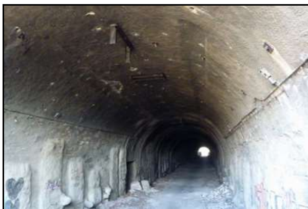
La galerie du tunnel