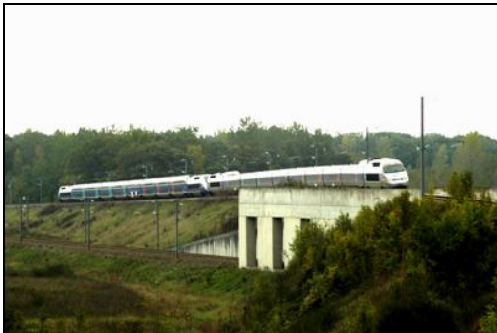
La sortie de la galerie vue latéralement