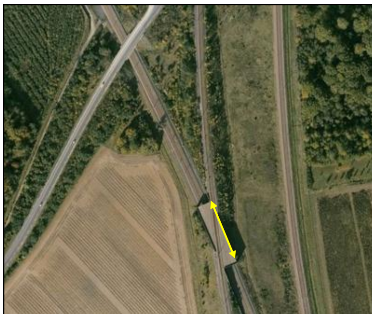
Vue aérienne en gros plan de la galerie

Si cette fiche comporte des erreurs ou des oublis, merci de nous le signaler.