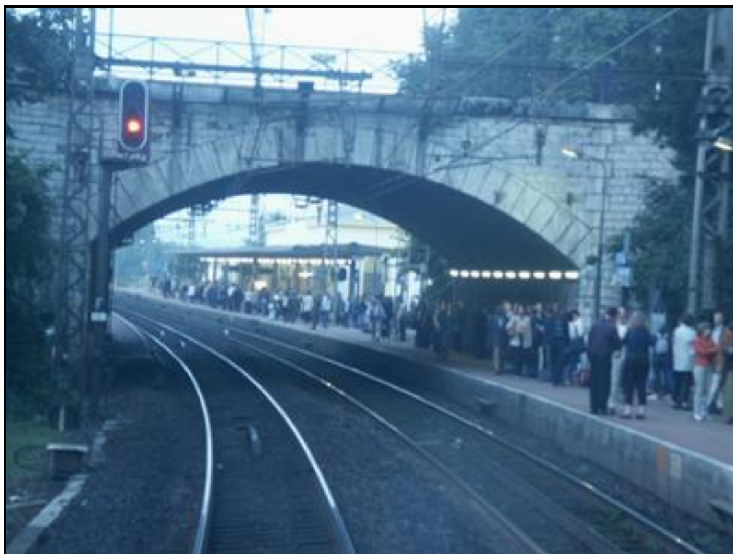
L'entrée de la galerie vue depuis la cabine de conduite d'un train