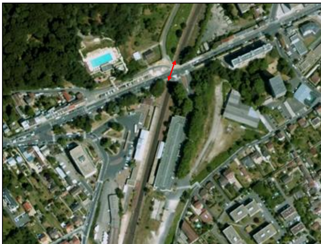
Vue aérienne de la galerie de la gare

Si cette fiche comporte des erreurs ou des oublis, merci de nous le signaler.