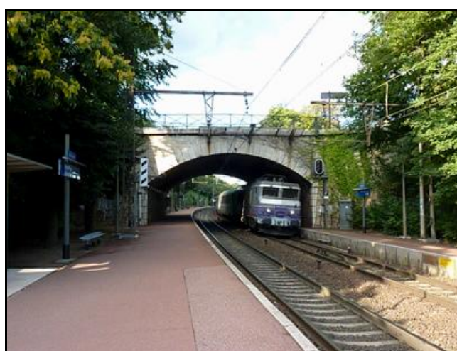
Ci-dessus et ci-dessous, divers passages dans la galerie de la gare