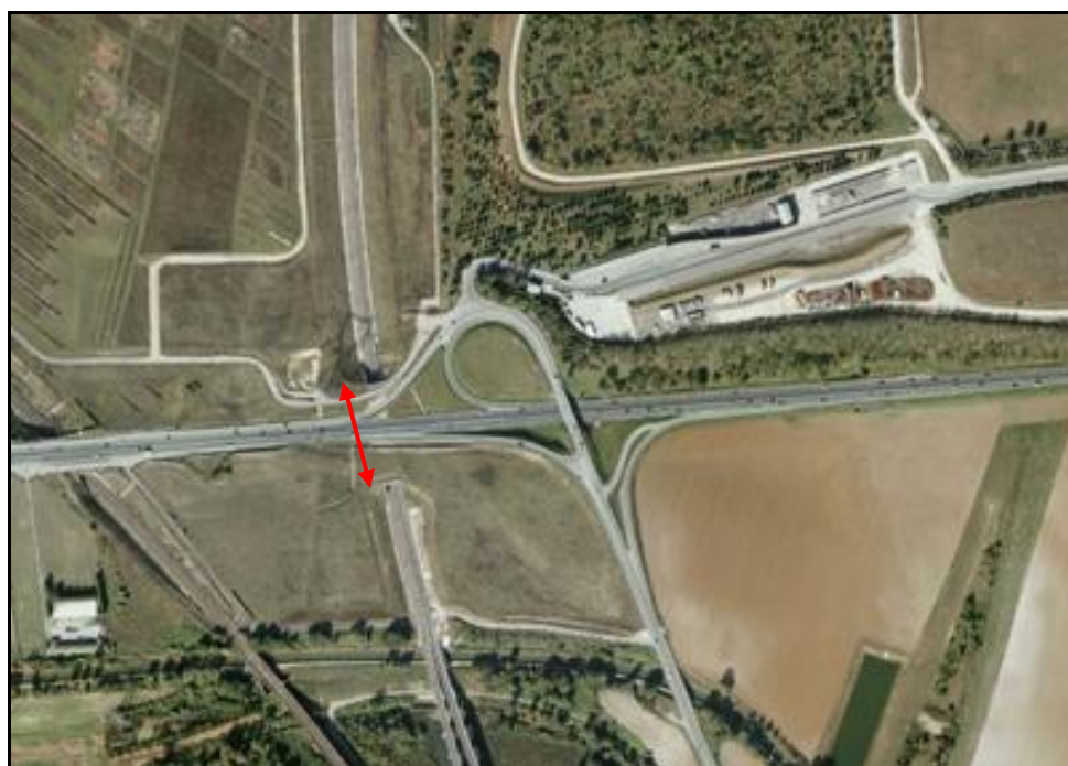
Vue aérienne de la galerie