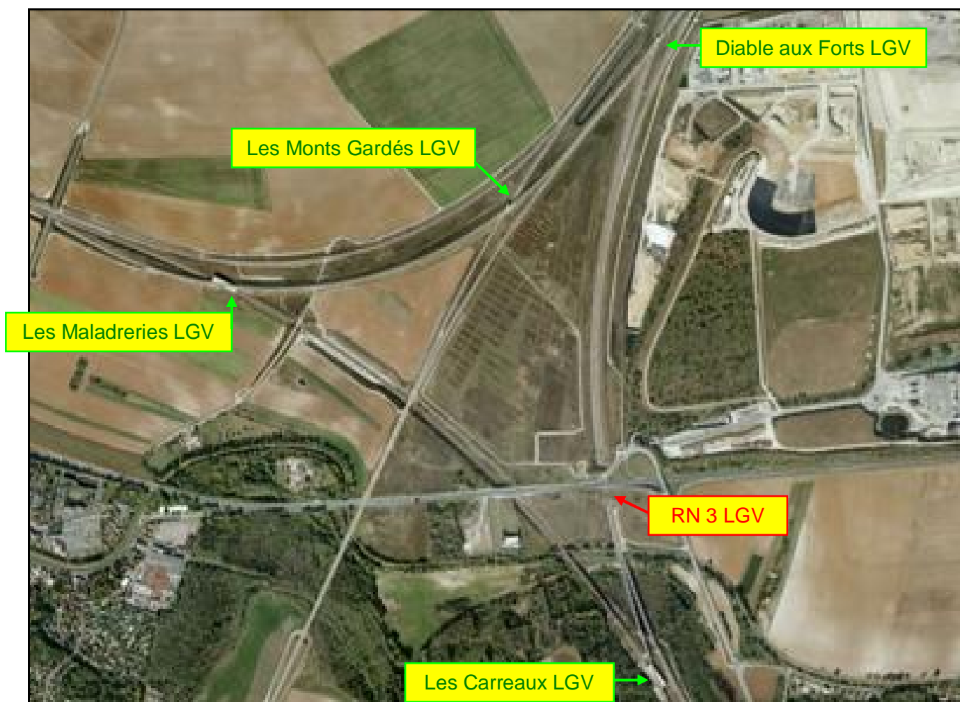
Vue aérienne globale du nœud LGV des Monts Gardés et de ses galeries

Si cette fiche comporte des erreurs ou des oublis, merci de nous le signaler.