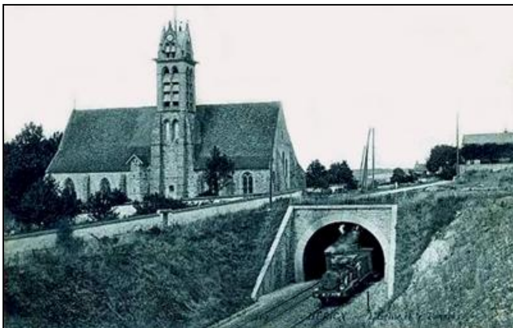
Belle photo de la sortie du tunnel d'Héricy, du temps de la vapeur

Si cette fiche comporte des erreurs ou des oublis, merci de nous le signaler.