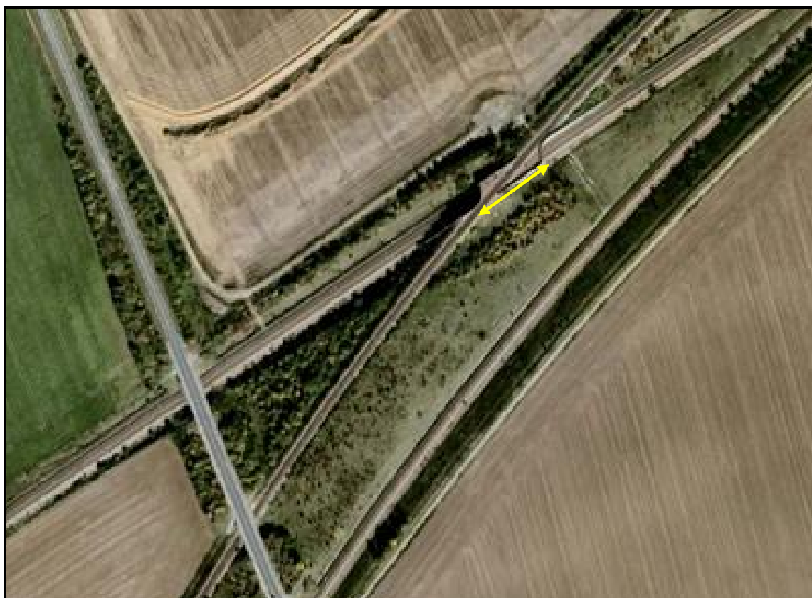
Vue aérienne de la galerie

Si cette fiche comporte des erreurs ou des oublis, merci de nous le signaler.