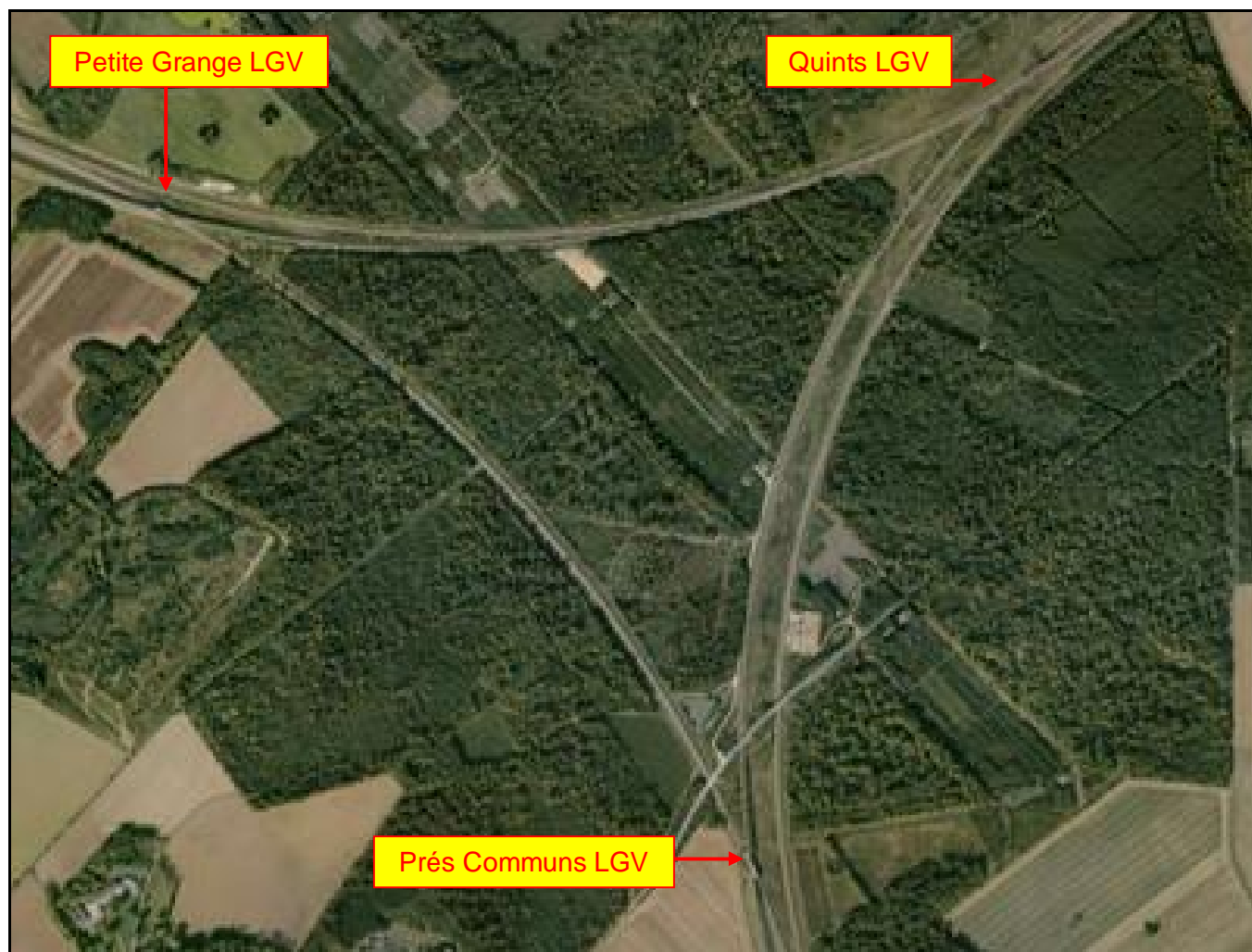
Vue aérienne du nœud LGV de Coubert et de ses sauts de mouton

Si cette fiche comporte des erreurs ou des oublis, merci de nous le signaler.