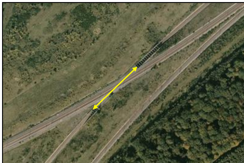
Vue aérienne de la galerie