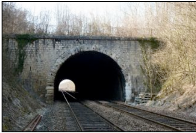
Ci-dessus et ci-dessous, après la galerie des Bouchots hivernale, la galerie des Bouchots estivale