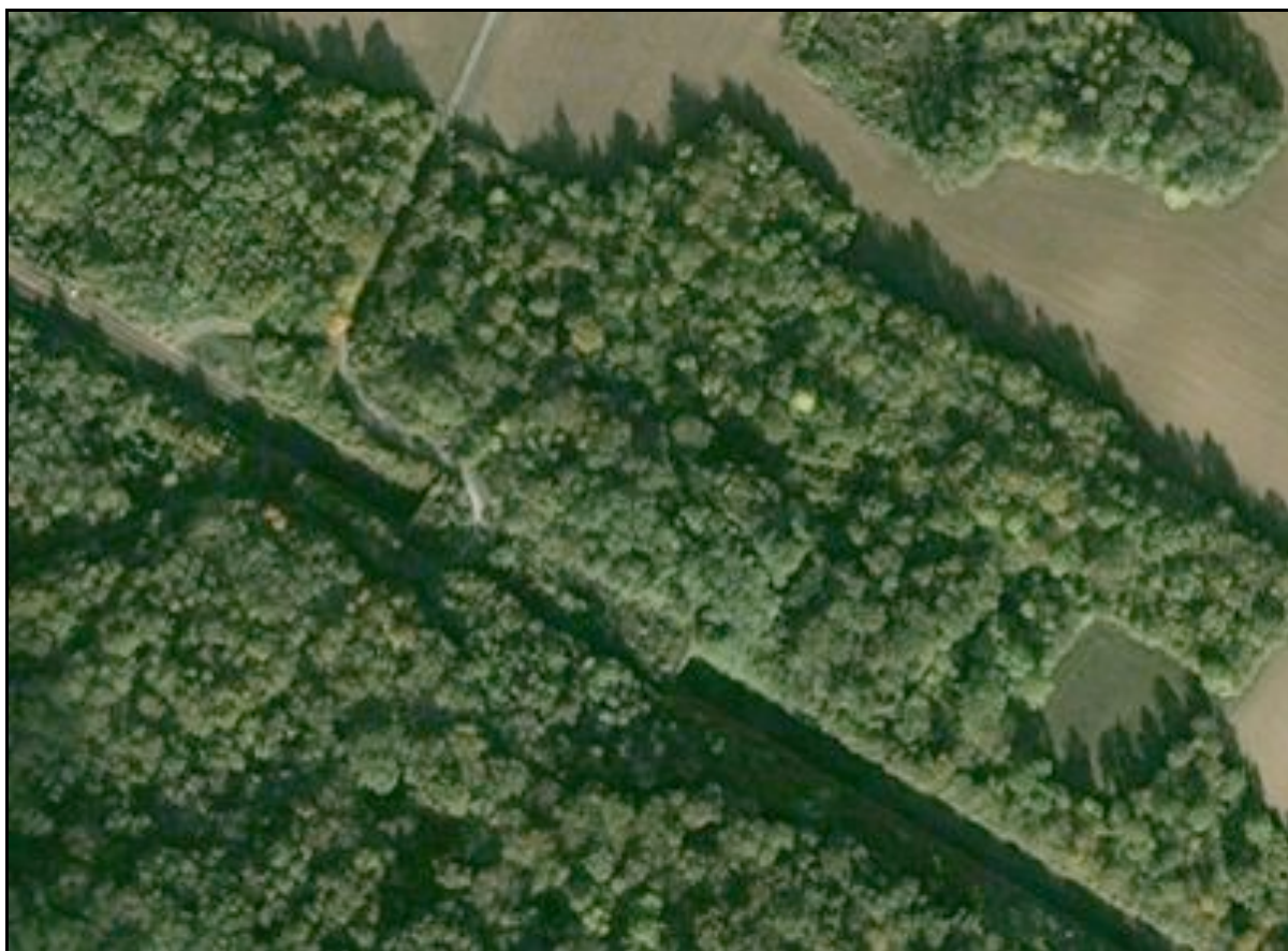
Vue aérienne de la galerie

Si cette fiche comporte des erreurs ou des oublis, merci de nous le signaler.