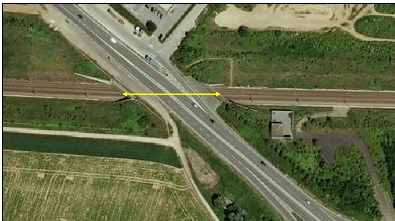
Vue aérienne de la galerie

Quelqu'un a pris mon derrière. Qui prendra mon visage ?