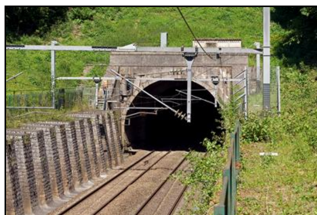
La sortie et sa tranchée d'accès renforcée

Ci-contre, un turbotrain à la sortie du tunnel de Bréval, avant électrification et travaux de renforcement de sa tranchée d'accès