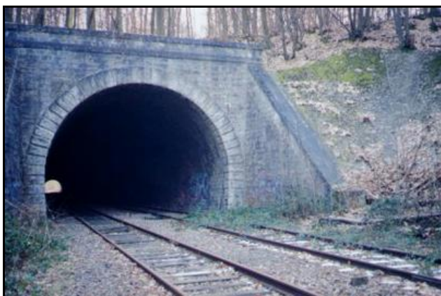
L'entrée avant remise en état