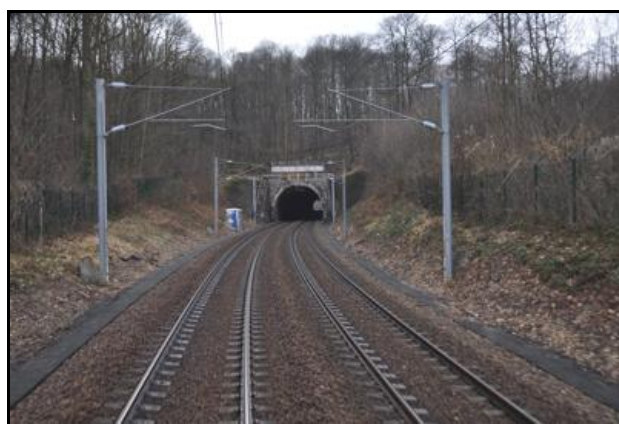
Et la sortie après remise en service de la ligne

Ci-contre, la sortie durant le chantier de réfection de la ligne en vue de son nouvel usage