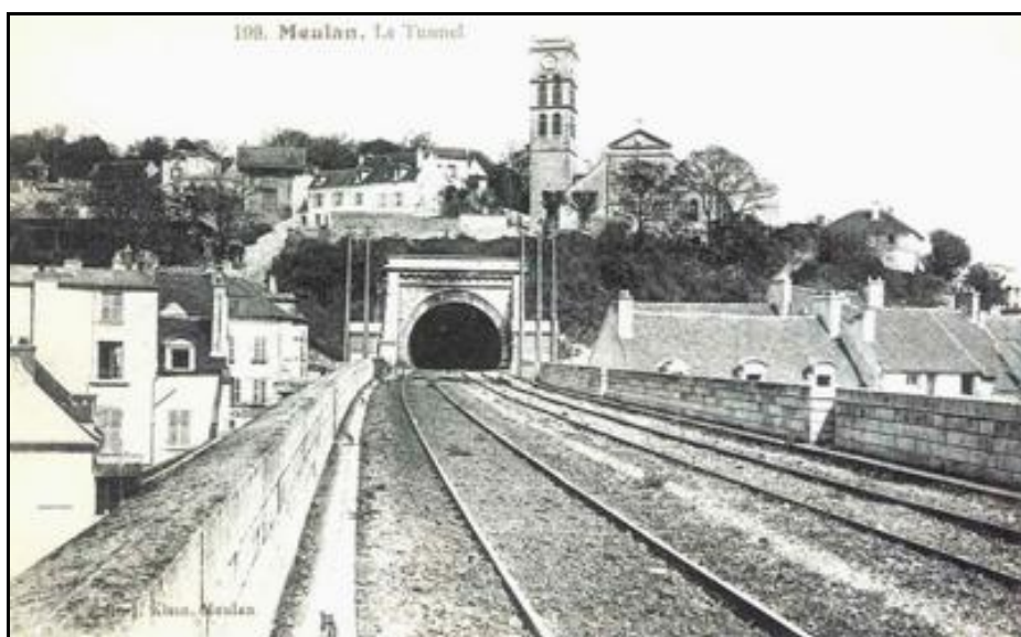
Sortie du tunnel de Meulan à l'époque de la vapeur