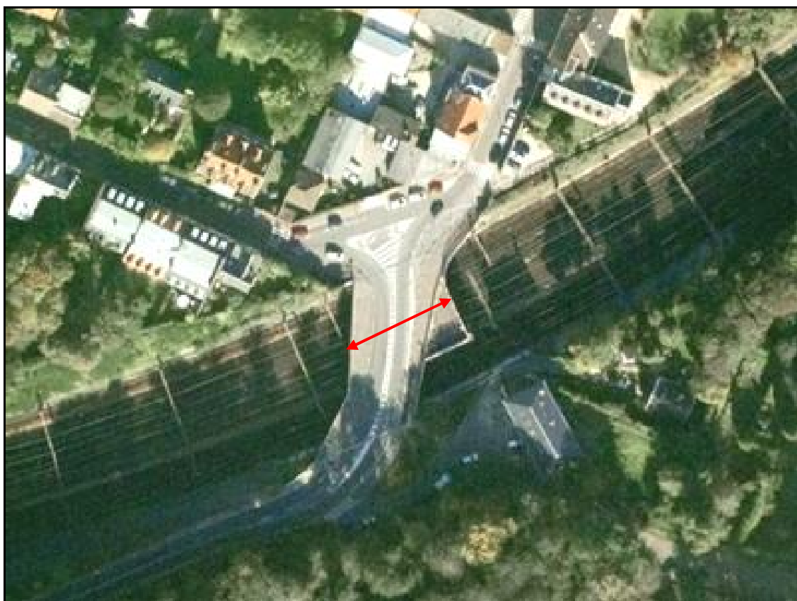
Vue aérienne de la galerie

Si cette fiche comporte des erreurs ou des oublis, merci de nous le signaler.