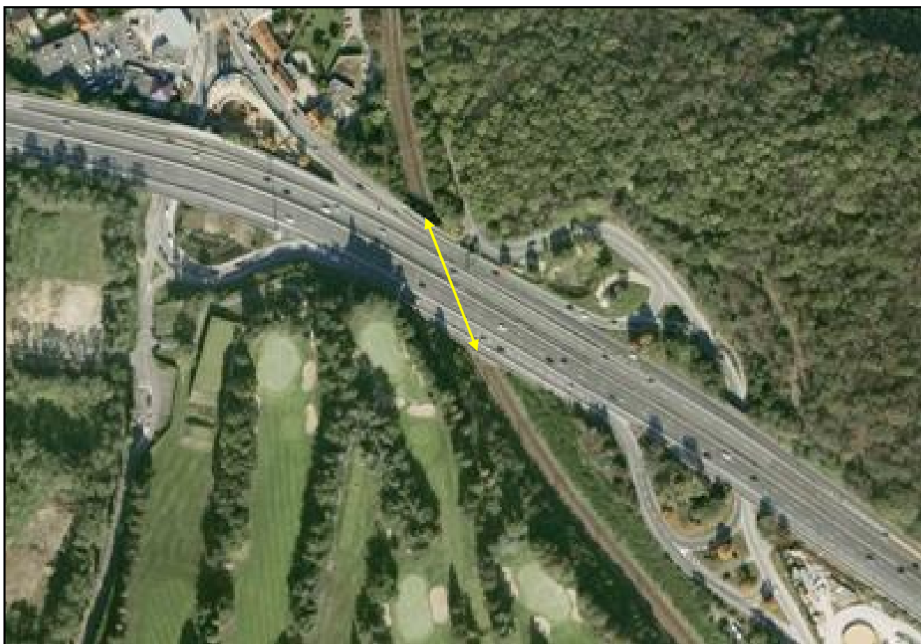
Vue aérienne de la galerie du Pont Colbert

Si cette fiche comporte des erreurs ou des oublis, merci de nous le signaler.