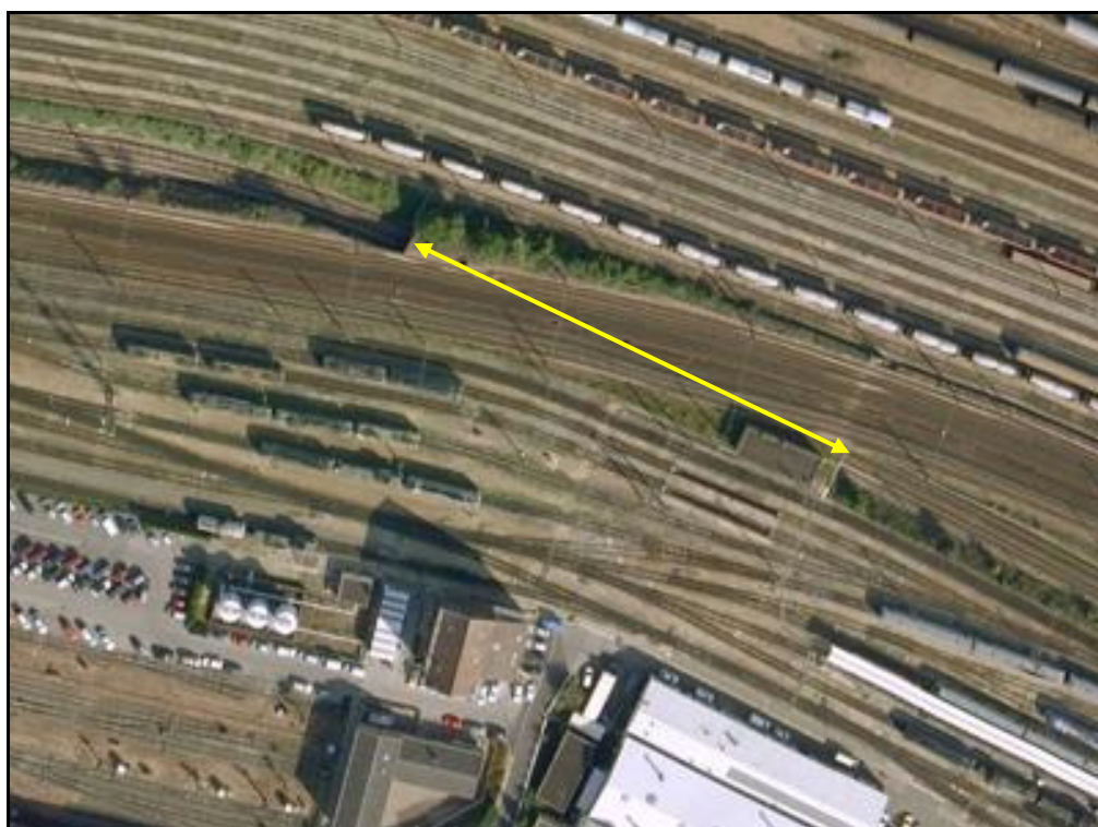
Vue aérienne du saut de mouton du dépôt

Si cette fiche comporte des erreurs ou des oublis, merci de nous le signaler.