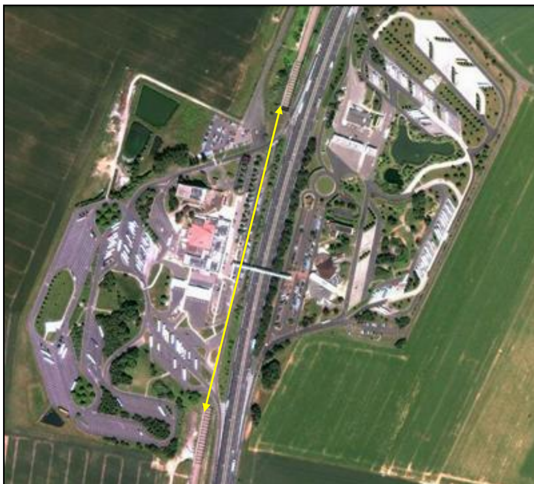
Vue aérienne de la galerie et de l'aire de repos d'Assevillers

Si cette fiche comporte des erreurs ou des oublis, merci de nous le signaler.