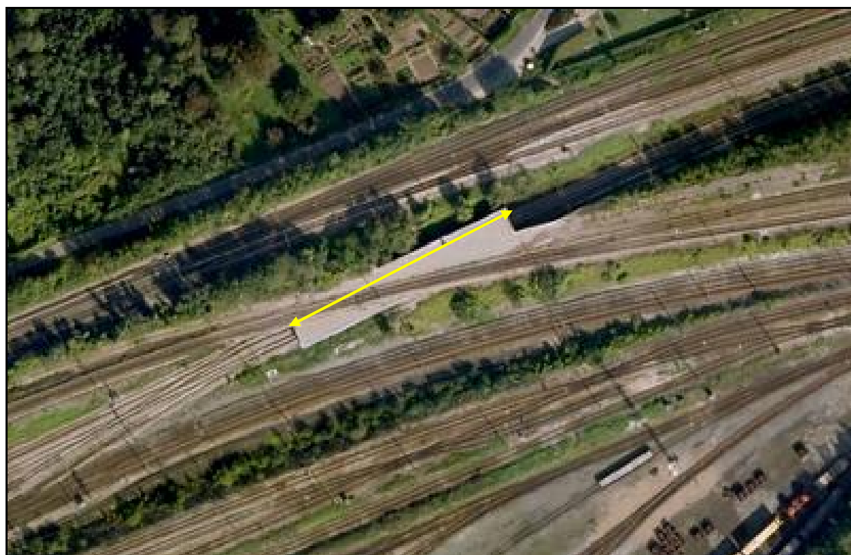
Vue aérienne du saut de mouton de la Canardière Centre

Si cette fiche comporte des erreurs ou des oublis, merci de nous le signaler.