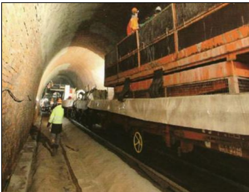
Travaux de réfection dans le tunnel

Si cette fiche comporte des erreurs ou des oublis, merci de nous le signaler.