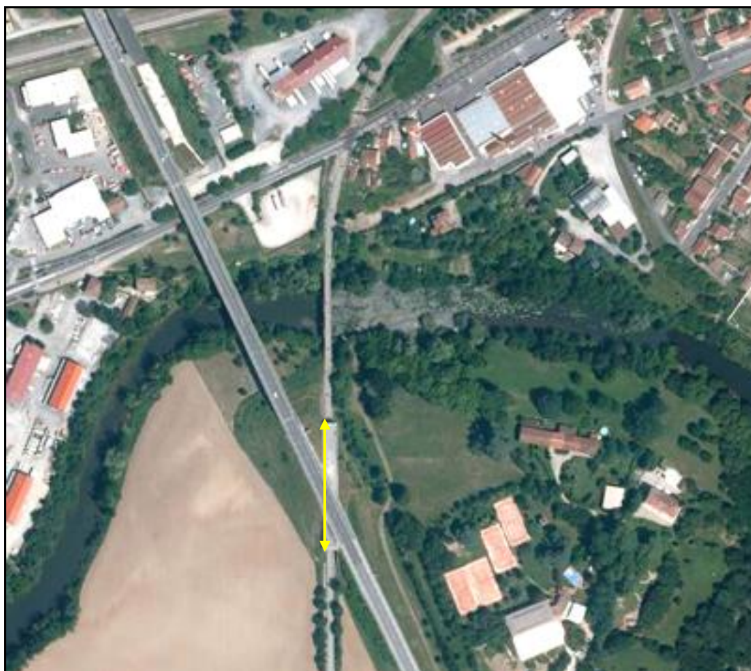
Vue aérienne du faux tunnel du Clot

Si cette fiche comporte des erreurs ou des oublis, merci de nous le signaler.