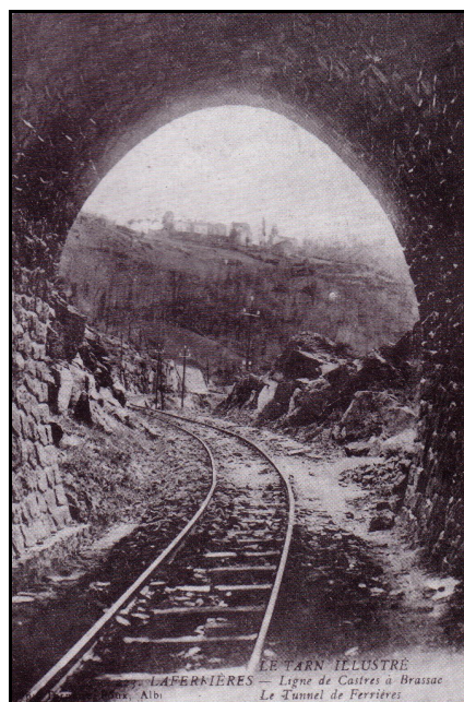
Photo d'époque de la sortie du tunnel avec le château de Ferrières sur la colline

Quelqu'un a pris mon derrière. Qui prendra mon visage ?