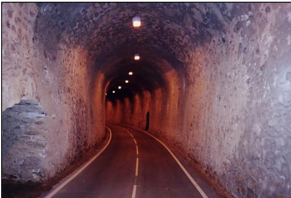
L'intérieur éclairé de la galerie transformée en route touristique

Si cette fiche comporte des erreurs ou des oublis, merci de nous le signaler.