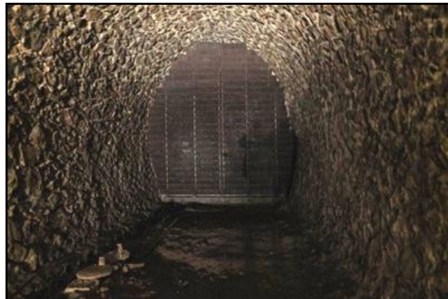
Le mur terminal recouvert de son récupérateur de projectiles métallique