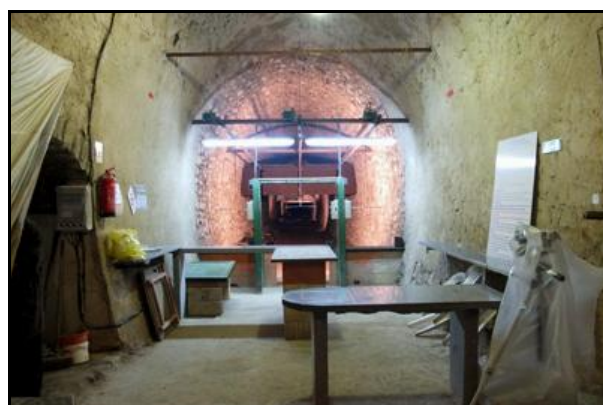
Après les deux premiers stands de tir latéraux, débouché sur le troisième et dernier stand qui occupe toute la largeur de la galerie dans la grande ligne droite qui termine le tunnel