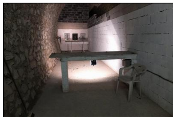
L'intérieur du stand de tir à 15 m