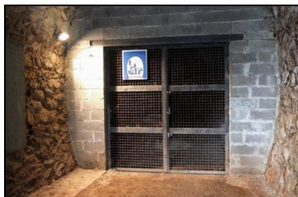
L'entrée et la grille d'accès au stand de tir souterrain