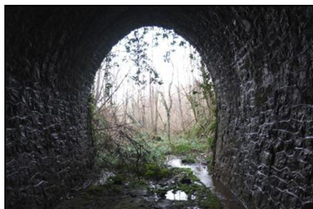
L'entrée du souterrain vue de l'intérieur avec le chemin d'accès au stand de tir