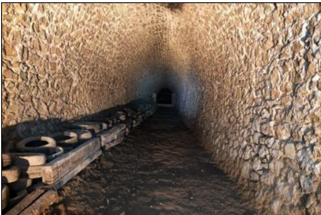
Le stand de tir à 100 m Au fond, le pas des cibles