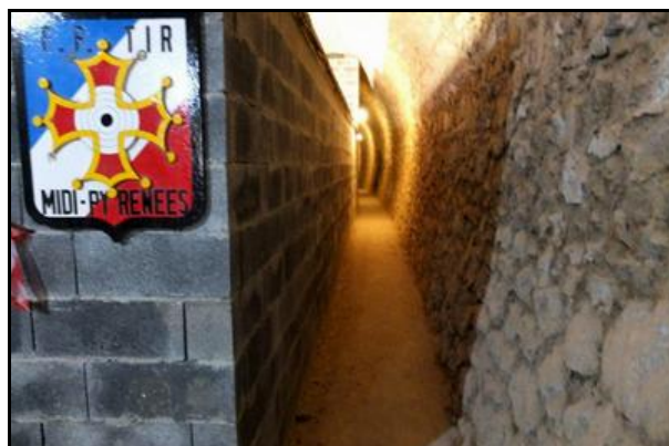
Le premier stand de tir à 15 m et le passage latéral qui permet de le longer