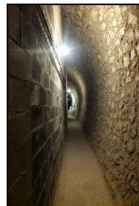
Le stand de tir à 25 m qui fait suite au premier, et le passage latéral qui permet de le longer