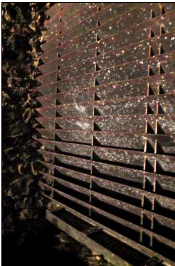
Le récupérateur de projectiles avec ses lamelles de déflexion Les points blancs sont les impacts de balles

Si cette fiche comporte des erreurs ou des oublis, merci de nous le signaler.