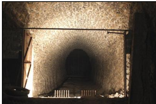
Le pas des cibles du stand de tir à 100 m A l'arrière-plan, le mur terminal qui ferme le tunnel