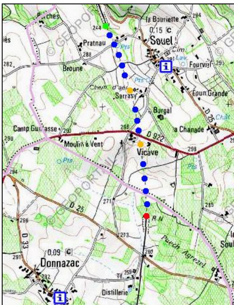
Les deux points orange indiquent les cheminées d'aération