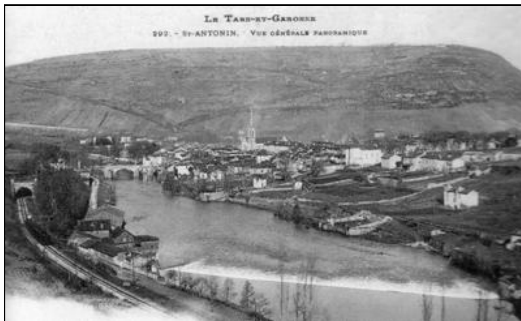
Vue panoramique de Saint Antonin Noble Val faisant apparaître l'entrée du tunnel à gauche

Si cette fiche comporte des erreurs ou des oublis, merci de nous le signaler.