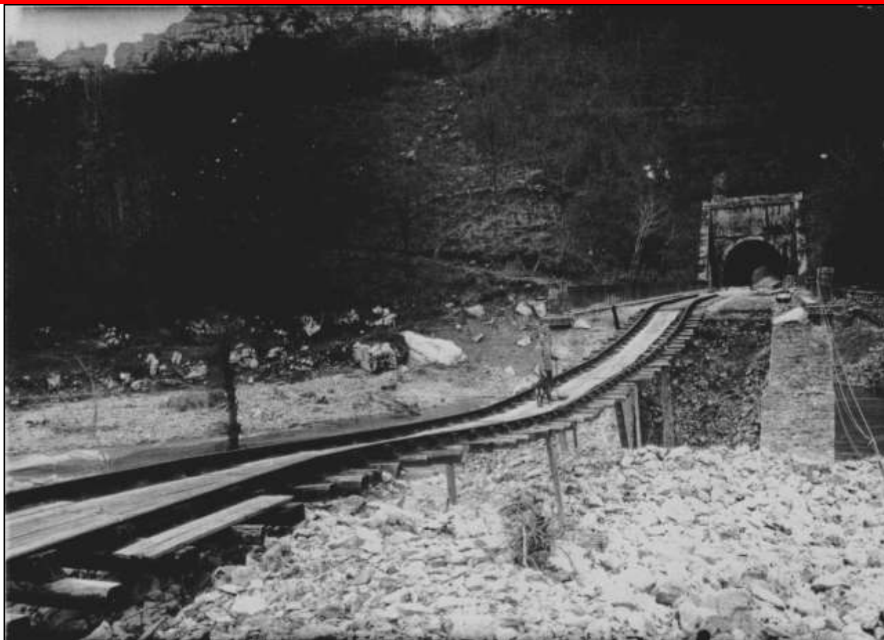
Cliché exceptionnel de la ligne après la crue de l'Aveyron de mars 1930. Le pont a été emporté, la voie est suspendue dans le vide !