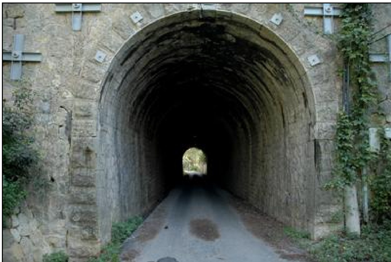
Belle vue de l'entrée et de la galerie du tunnel