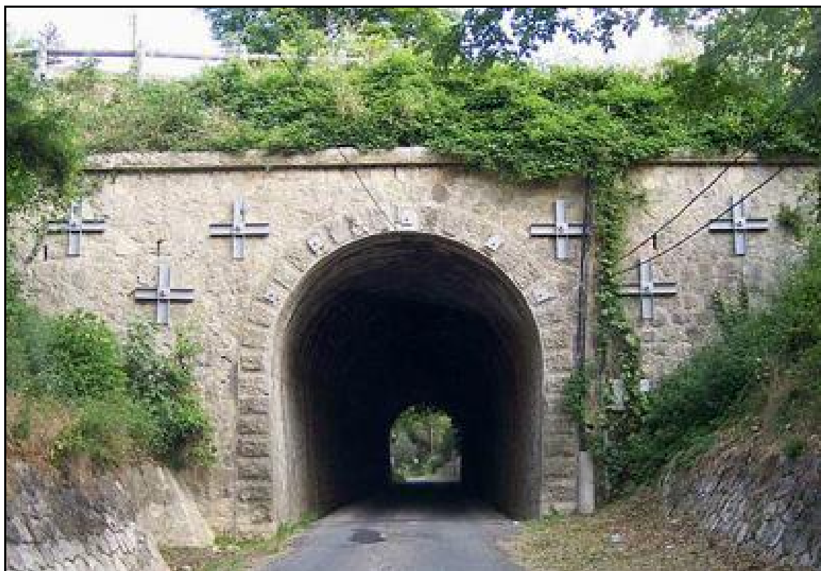
Ci-dessus et ci-dessous, autres vues de l'entrée dont le fronton a reçu des renforts