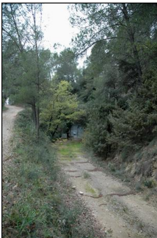
Ci-dessus et ci-dessous, l'entrée et la sortie du tunnel du temps de la champignonnière