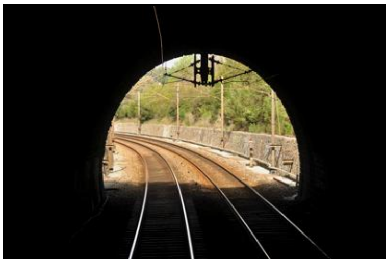
L'entrée vue de l'intérieur