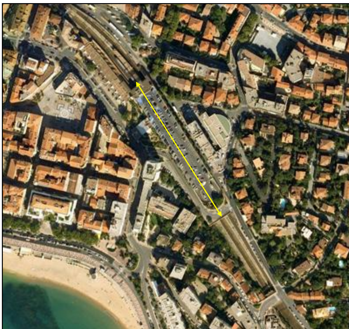
Vue aérienne de la gare souterraine de Saint Raphaël

Quelqu'un a pris mon derrière. Qui prendra mon visage ?