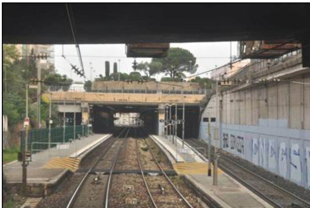
Autre vue de la sortie du faux tunnel de la gare de Saint Raphaël

Si cette fiche comporte des erreurs ou des oublis, merci de nous le signaler.