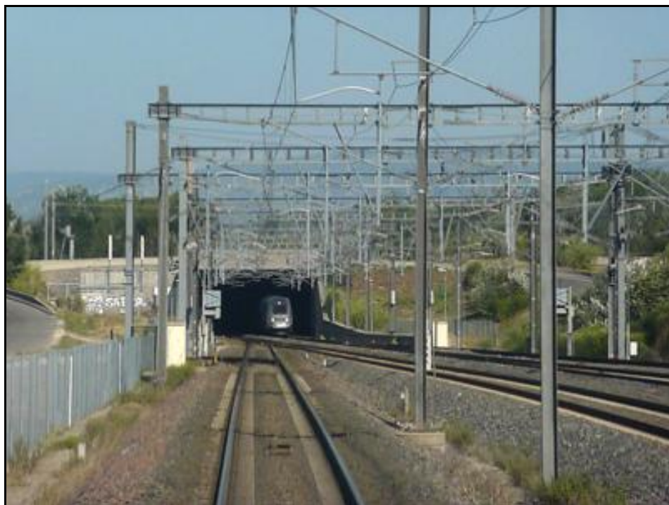
Un TGV Duplex remontant vers Paris sort de l'entrée de la galerie