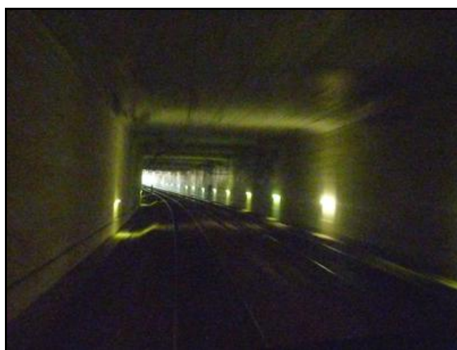
Ci-dessus et ci-dessous, la galerie vue depuis la cabine d'un TGV