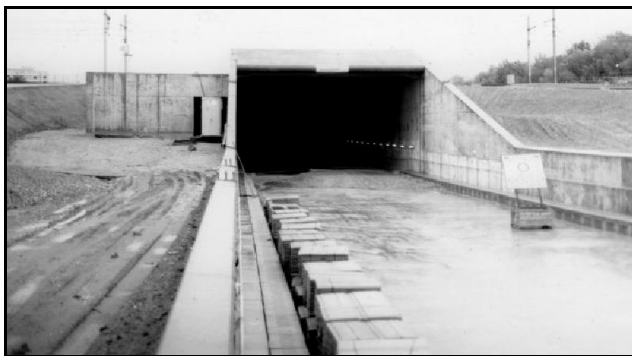
Ci-dessus et ci-contre, le faux tunnel d'Avignon en construction Au-dessus, la ligne classique vers Tarascon et Arles