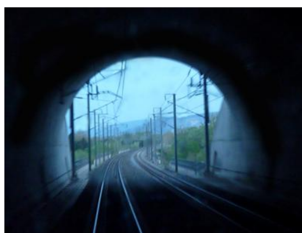
L'entrée et la sortie du tunnel vues de l'intérieur A gauche, photo originale prise à pleine vitesse, à partir d'un TGV remontant vers Paris

Si cette fiche comporte des erreurs ou des oublis, merci de nous le signaler.