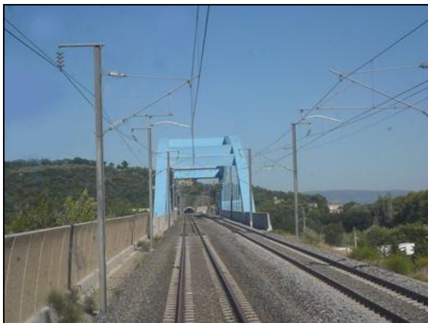
Tout au fond, après le pont de Bonpas, l'entrée du tunnel