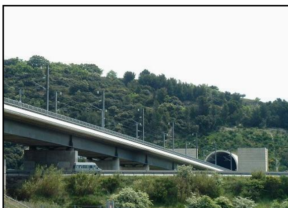
Le viaduc de Bonpas et l'entrée du tunnel