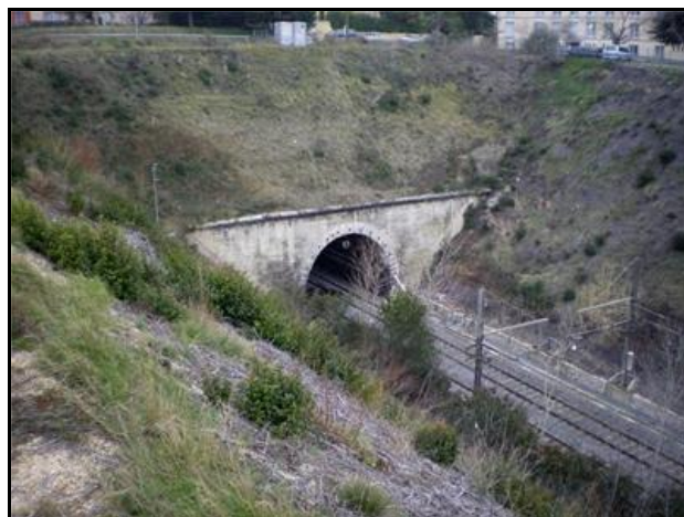
Deux vues plongeantes et de trois quarts des entrée et sortie du tunnel