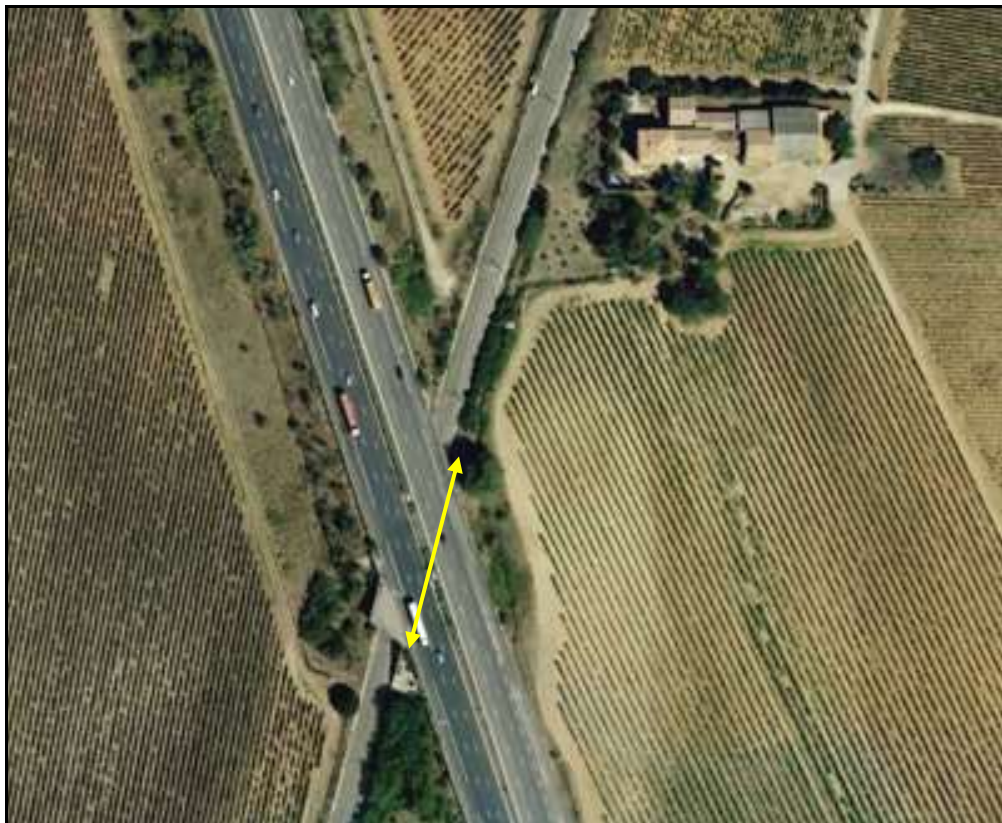
Vue aérienne de la galerie de la D 950

Si cette fiche comporte des erreurs ou des oublis, merci de nous le signaler.